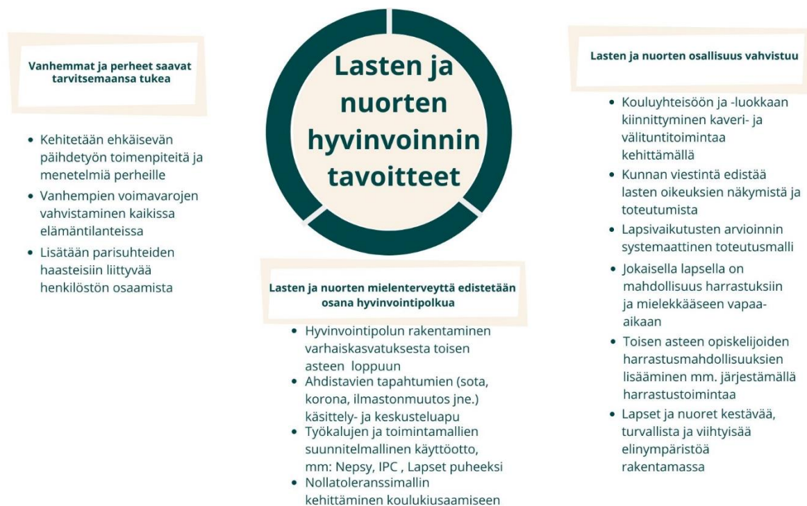
Kuvio 1. Lasten ja nuorten hyvinvointisuunnitelman tavoitteet ja toimenpiteet.

Kuntalaisten hyvinvointia edistävät toimenpiteet ja tavoitteet kootaan valtuustokauden osalta laajaan hyvinvointikertomukseen. Sen tavoitteiden toteutuminen raportoidaan valtuustolle vuosittain. Lasten ja nuorten hyvinvointisuunnitelma niveltyy osaksi laajaa hyvinvointikertomusta